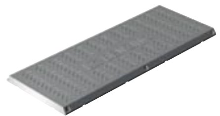
PLB 765 76,5 x 30 cm