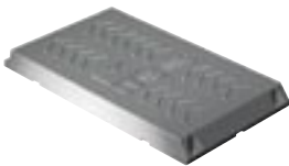
PLB 170 17 x 30 cm